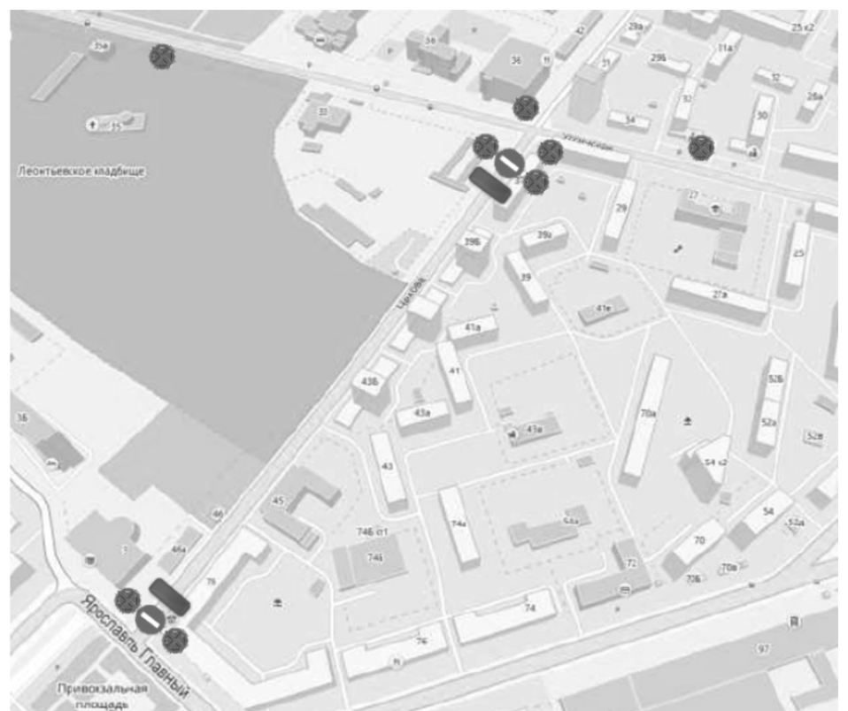
Схема расстановки временных дорожных знаков на время проведения мероприятий, посвященных памяти хоккейной команды «Локомотив» 07.09.2021

Приложение к приказу директора департамента городского хозяйства от 30.08.2021 № 127