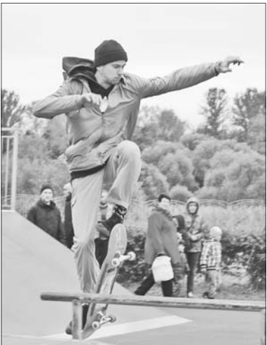
А вам слабо?

В Ярославль приехали москвичи, спортсмены из Московской области, ивановцы, костромичи, рыбинцы и саратовские скейтбордисты. Представители самого молодого спорта из программы летней Олимпиады соотязались в трех дисциплинах.