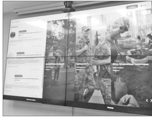
Главная страница портала.

Читать сообщения на портале сможет любой, но для того чтобы направить обращение, необходимо пройти регистрацию, указав адрес электронной почты. Направить вопрос можно по любой из семи категорий: автомобильные дороги, безопасность, дом и придомовые территории, ЖКХ, медицинские учреждения, работа МФЦ, транспорт.