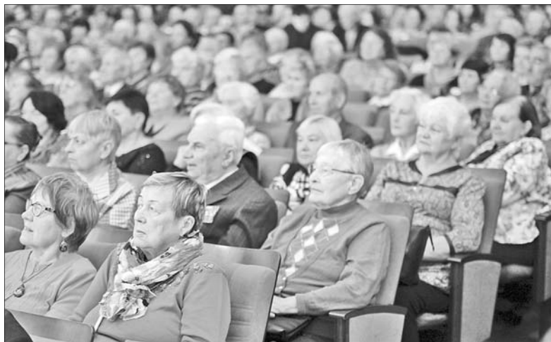
Зал был полон.

Накануне Дня пожилого человека, который традиционно отмечается 1 октября, в ДК Добрынина прошел праздник, посвященный ярославцам почтенного возраста.