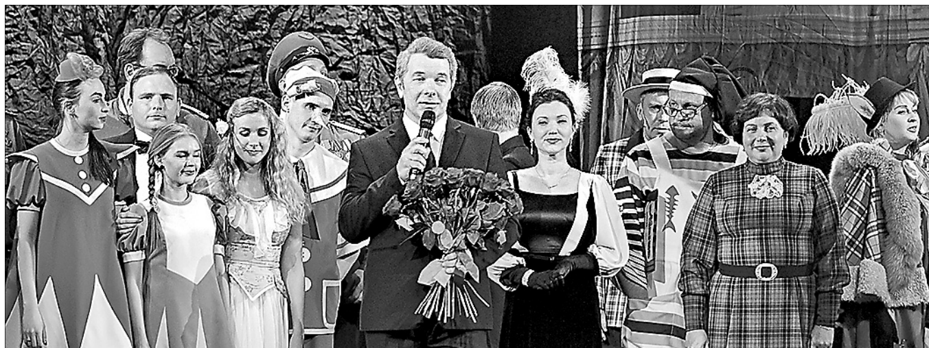
На сцене труппа ТЮЗа.