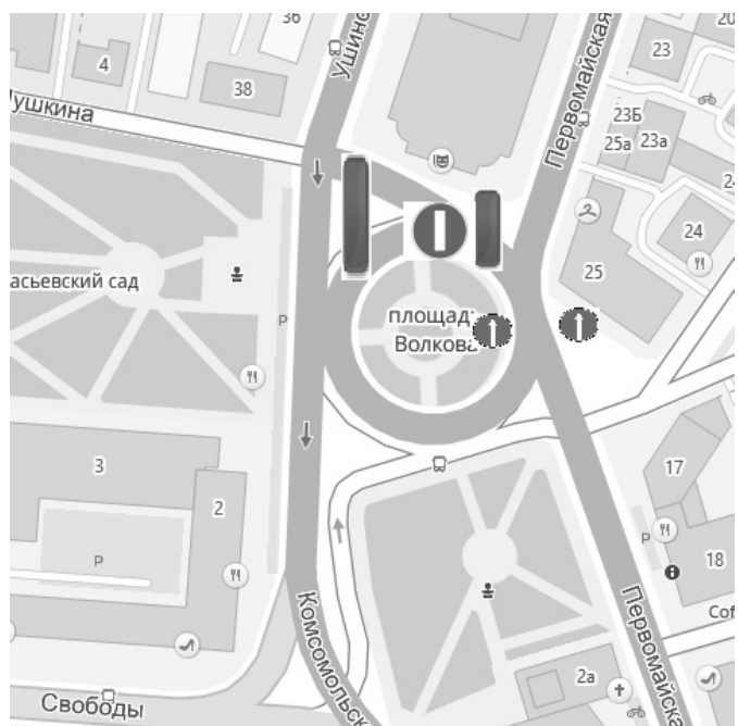
Схема расстановки временных дорожных знаков на время проведения церемонии закрытия Фестиваля «Будущее театральной России» 17.05.2022

Департамент социально-экономического развития города мэрии города Ярославля объявляет конкурс на включение в кадровый резерв на должность муниципальной службы старшей группы должностей муниципальной службы управления планирования экономического развития города - главного специалиста отдела инвестиционной и налоговой политики.