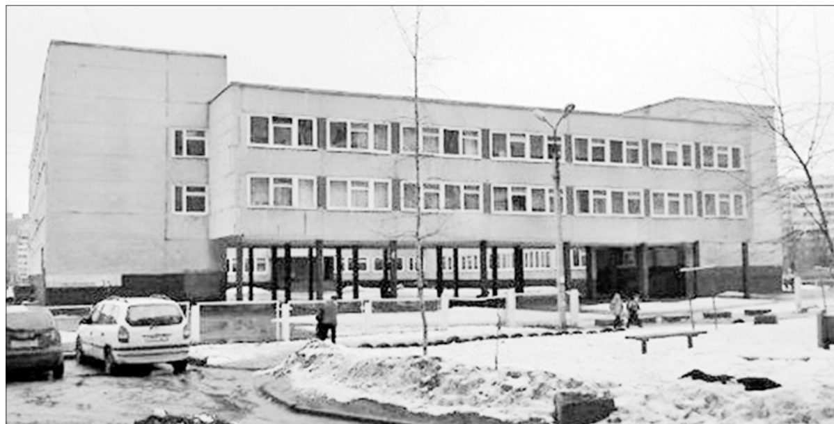
Современное здание школы.