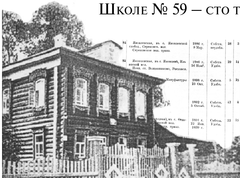
Когда-то в этом доме учились заволжские ребята.