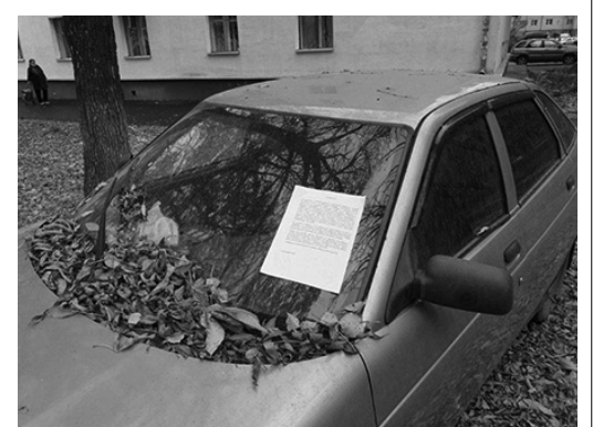
Транспортное средство расположено по адресу: г. Ярославль, у дома № 12 по ул. Кудрявцева