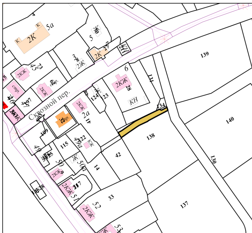
Схема части земельного участка по адресу: Российская Федерация, Ярославская область, городской округ город Ярославль, город Ярославль, Сквозной переулок, земельный участок 8а, в отношении которого устанавливается публичный сервитут