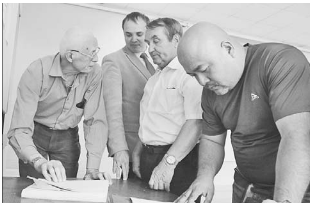
Общественный совет проверяет документы.

Б ольшая Федоровская давно отфрезерована, около двух недель назад подрядчик вернулся на нее, но работы ведутся неспешно. Транспорт по улице идет с раннего утра до позднего вечера, только пыль столбом сто-