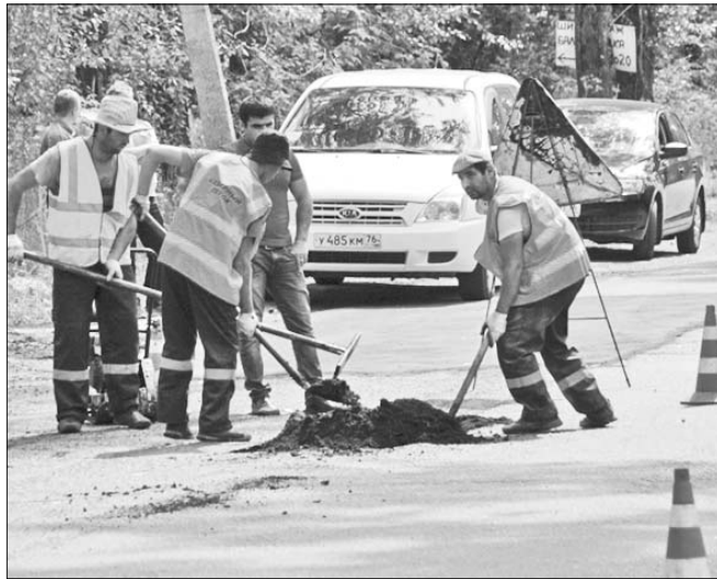
Идет ремонт улицы Спартаковской. Пока временный.

Ремонт дорог – это сегодня главная тема в городе. И хотя мы стараемся освещать ход ремонтно-дорожных работ во всех районах Ярославля, центральные улицы на страницах газеты мелькают все же чаще. Но, конечно, дороги важны везде.