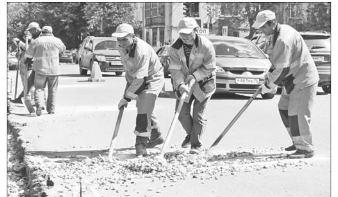
Работы по укладке бордюрного камня.

Одна из самых больших магистралей в центре города – улица Свердлова. У пешеходов и автомобилистов было много нареканий на ее состояние, ремонт здесь требовался давно.