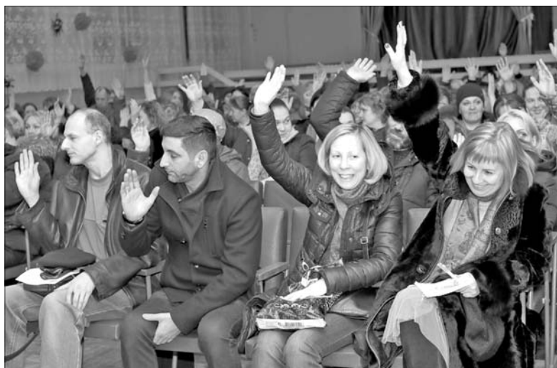
Родители школьников проголосовали за ограждение.

К началу следующего учебного года территория школы № 11 будет огорожена.