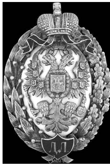
Знак Демидовского лицея.

Обращает на себя внимание очень широкая география учившихся в Ярославле лицеистов. 120 человек с четвертого курса, т.е. гораздо больше половины, не ярославские. Как правило, из разных городов и губер-