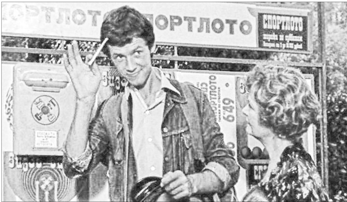
Кадр из кинофильма «Спортлото-82».