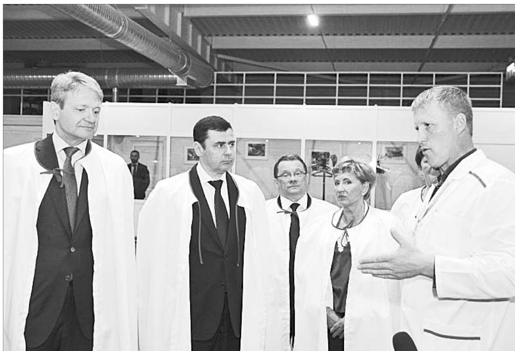
Рабочая поездка на птицефабрику «Волжанин»

Оживлённую дискуссию на Губернаторском совете вызвала тема фермерства. Помимо увеличения размера грантов начинающим фермерам правительство области активно помогает малым хозяйствам в продвижении на внутренних и внешних рынках.