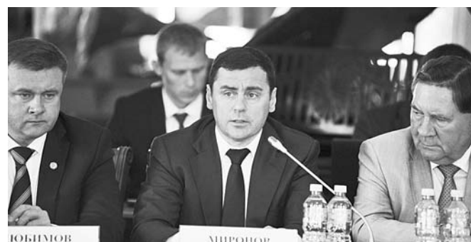
На заседании Совета при полномочном представителе президента в ЦФО

Правительство области сегодня серьёзно перестраивает туристическую отрасль. В соавторстве с экспертным сообществом разработана стратегия развития отрасли. Речь идёт о формировании полноценной туристической отрасли, которая приносит доходы в бюджет, стимулирует развитие сопутствующего малого бизнеса, обеспечивает занятость населения, даже активизирует внешнеторговый